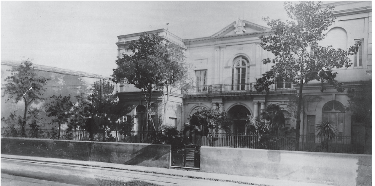
Fig. 3. Hospital de Hombres, barrio de San Telmo, Buenos Aires primera escuela de medicina hasta 1858 (foto 1880)